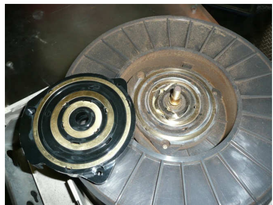
新品との比較及び1次側接点により削れめくれ上がり破損した2次側接点リング(右側)