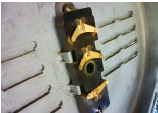
接点の潤滑油が切れ摩耗が激しい危険な状態