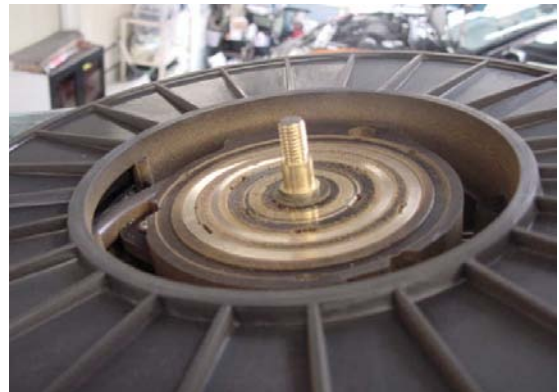
左記同様接点の削れた粉が接点同士の境界線に蓄積しショートする危険性がある状態